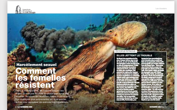
LES DOSSIERS Éthologie Chez les animaux, comment les femelles résistent au harcèlement sexuel...