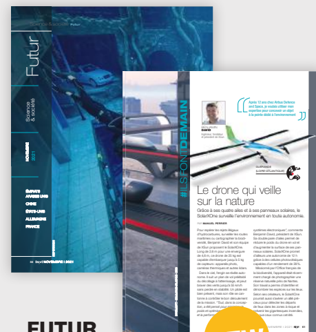
FUTUR Ils font demain! Pour un voyage entre le passé et le futur...