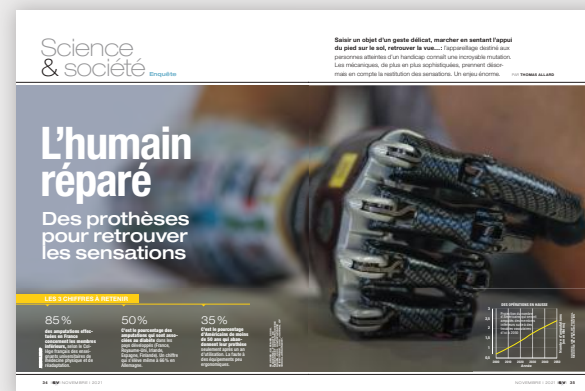
SCIENCE & SOCIÉTÉ Une grande enquête de médecine Des prothèses pour retrouver les sensations