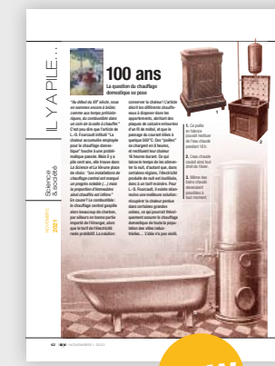
Il y a pile... 100 ans