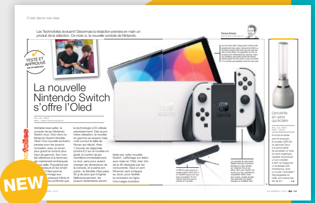
C'EST DANS NOS VIES Technofolies La rédaction teste l'objet du mois et aussi le choix «culture» de la rédaction