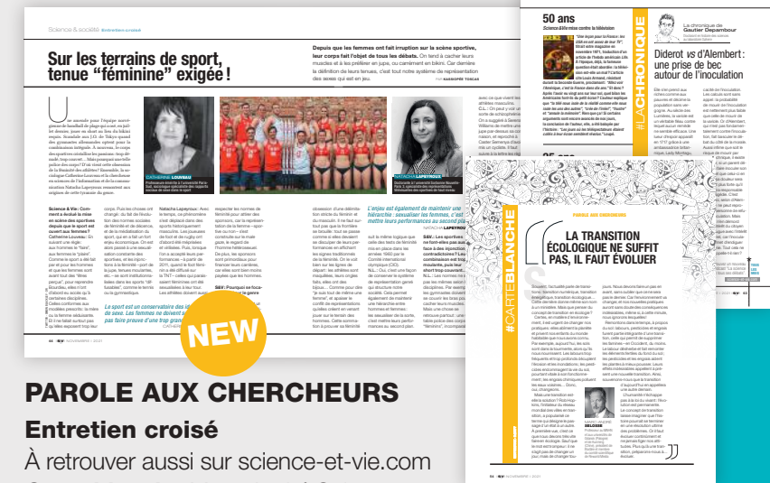
PAROLE AUX CHERCHEURS Entretien croisé À retrouver aussi sur science-et-vie.com Carte blanche Marc-André Selosse La chronique de Gautier Depambour et son podcast "La science dans tous ses débats" sur le site