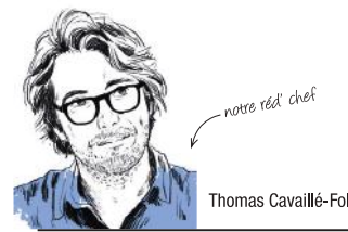
La rédaction de Science & Vie

plus de 100 ans d'existence, Science & Vie, magazine référent de culture scientifique, porte de fortes traditions mais son regard est résolument tourné vers l'avenir. Notre ambition voyage ainsi entre passé et futur. Nous voulons perpétuer ce que d'autres, avant nous, ont accompli : innover, aider Science & Vie à se transformer pour qu'il accompagne les grands enjeux de son époque et nous ravisse d'incroyables histoires de science... Et le faire si bien que dans 10, 20 ou 100 ans, d'autres se sentent à leur tour investis de cette même mission.»