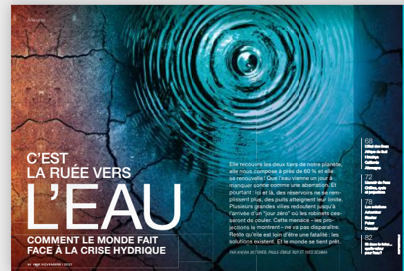
À LA UNE Le grand dossier du mois C'est la ruée vers l'eau...